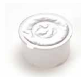
クァンタム JP定量中栓