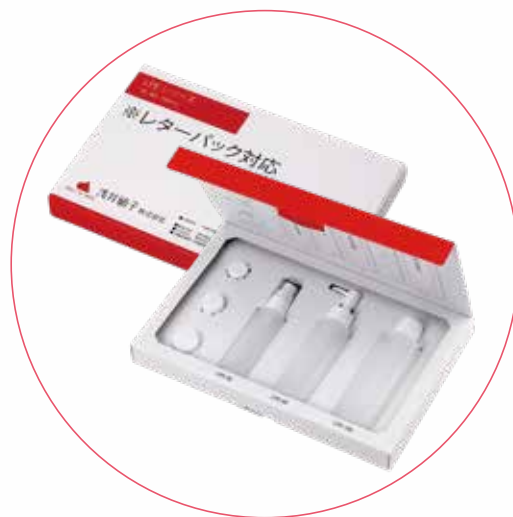
レターパック対応