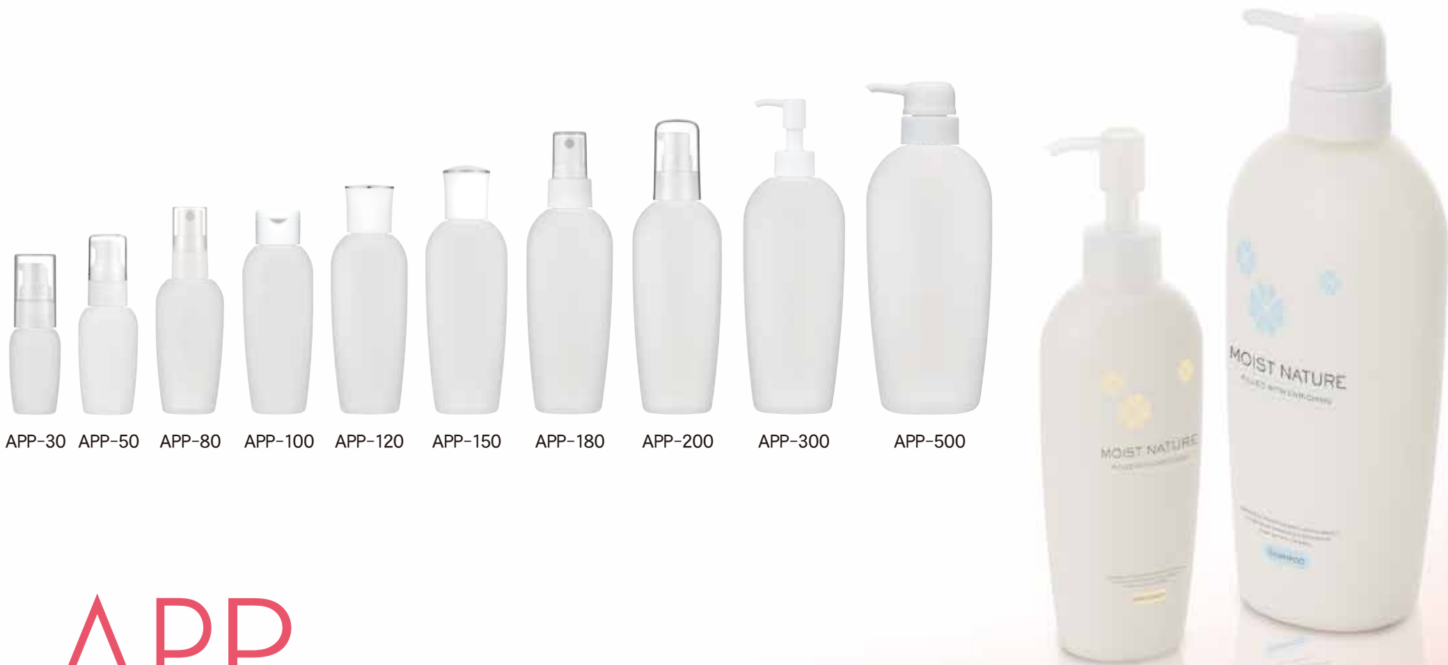
APP-30 APP-50 APP-80 APP-100 APP-120 APP-150 APP-180 APP-200 APP-300 APP-500