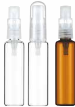
18φ Z25S 10ml (透明/褐色)