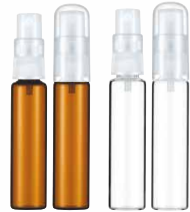
20φ Z35S 15ml (透明/褐色)