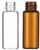
15φ Z25S 3ml (透明/褐色)