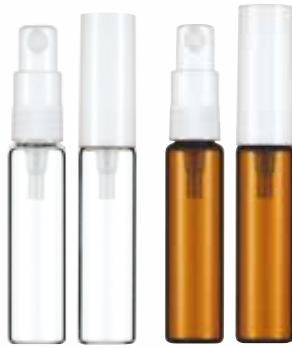
15φ Z25S 5ml (透明/褐色)