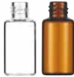
18φ Z25S 5ml (透明/褐色)