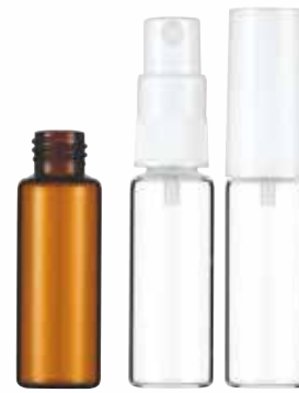
20φ Z35S 10ml (褐色/透明)